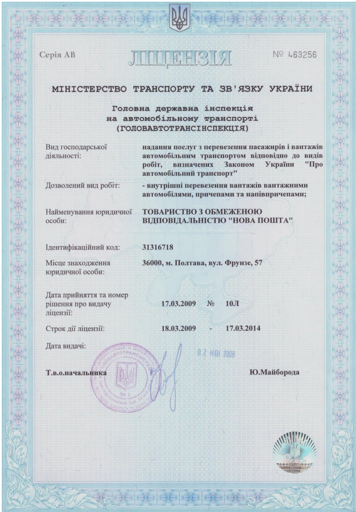
Рисунок 5.1 – Бланк (приклад) заповненої ліцензії